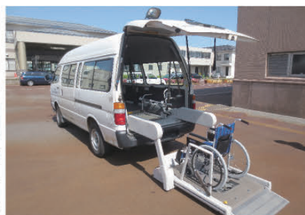
▲貸出用リフト付きバス