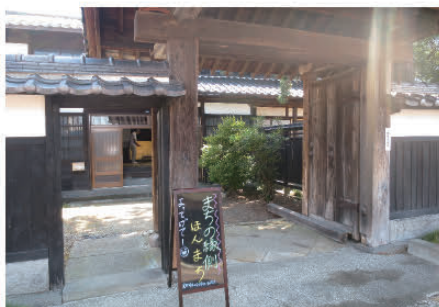
▲誰もが気軽に集える 「まちの縁側・ほんまち」