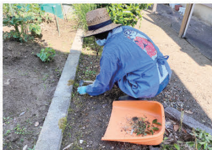
▲スマイルサポートにおける 協力会員の活動風景