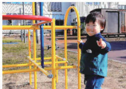
▲町内が管理する児童遊具の 新設・修繕の支援