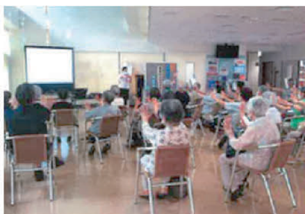
▲地域コミュニティにおけるふれあい いきいきサロンの活動風景