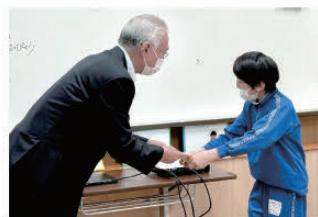
▲見附特別支援学校