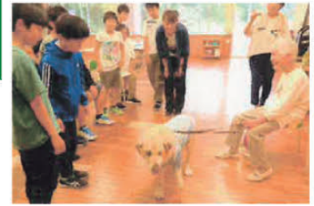
▲社会福祉普及校指定事業における盲導犬ユーザー講演会の風景