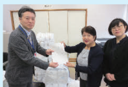
▲三条法人会からタオルを寄贈いただきました。